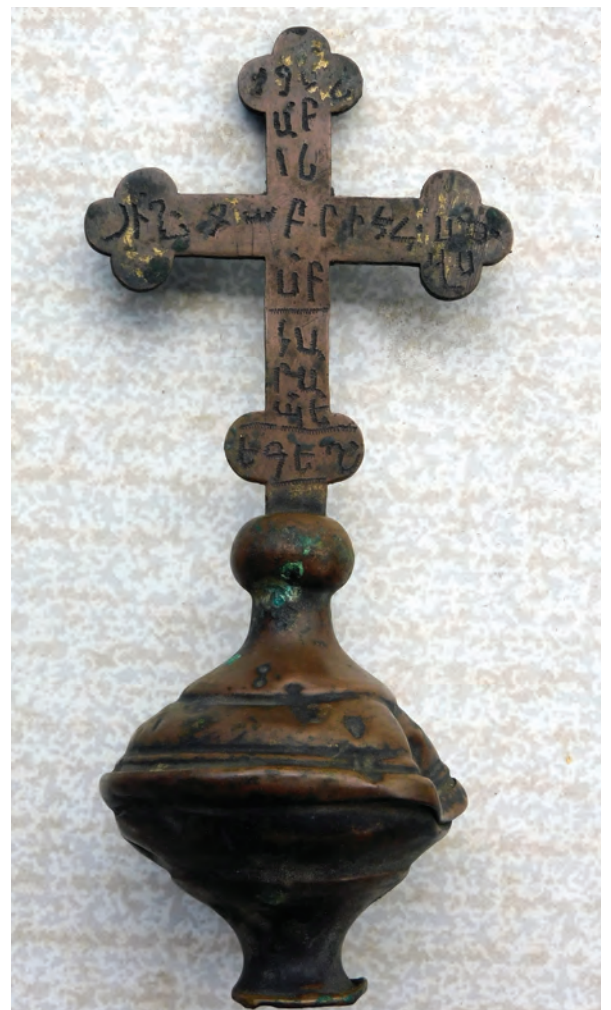
Խաչվառի գագաթի խաչը (լուս.՝ հողվածագրի, 2020 թ.)

Ամփոփելով վերնասացյալը՝ նշենք, որ Միսակ Խաչատրյանի շնորհիվ Սալնապատի Սր. Գրիգոր վանքից փրկված արժեքավոր այս մասունքներն իրենց արձանագրություններով ունեն ոչ միայն նվիրատվական նշանակություն, այլև չափազանց կարևոր են հայկական կիրառական արվեստի իրե- րի ուսումնասիրության և վանքի պատմությունն ամբողջացնելու առումով: