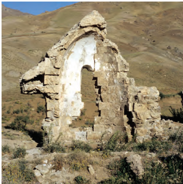
Վանքի Սր. Կարապետ եկեղեցու խորանի ավերակները

եղել է նաև Մեծ եղեռնի ժամանակ թալանված Սալնապատի Սր. Գրիգոր վանքում: Այդտեղ տեսնելով գետնին ընկած նշյալ իրերը՝ վերցրել է՝ փրկելով կորստից: Այժմ դրանք, որպես թանկագին մասունքներ, սերնդեսերունդ փոխանցվելով, պահվում են Հայրապետի տանը: