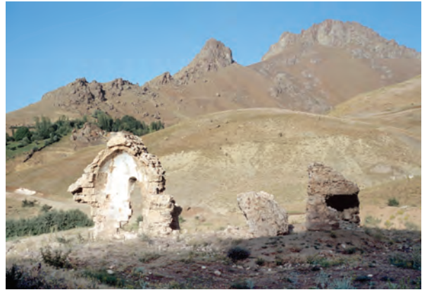
Մալնապատի Մր. Գրիգոր վանքը հարավ-արևմուտքից (լուս.՝ Վ. Բախմանի, 1913 թ.) և ավերումից հետո (լուս.՝ Ս. Կարապետյանի (ՀՃՈՒ), 2004 թ.)

Հայ ժողովրդի պատմության և մշակութային ժառանգության ուսումնասիրության բնագավառում չափազանց կարևոր տեղ են գրավում նաև Մեծ եղեռնից փրկված եկեղեցապատկան կիրառական արվեստի նմուշները: