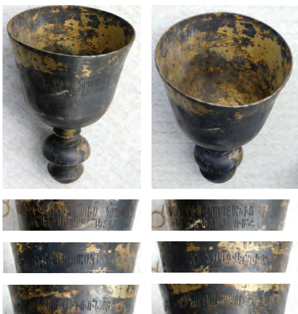
Սկիհը (լուս.՝ հողվածագրի (ՀՃՈԲ), 2020 թ.)

Սկիհից պահպանվել է բաժակը կոթով, իսկ հիմքի լայն պատվանդանը չի պահպանվել (հավանաբար 1915 թ. կտորել են վանքն ավերած թուրք և քուրդ հրոսակները): Արժաթաջրած պղնձե սկիհի վերին հատվածում՝ արտաքին մակերեսին, ողջ շրջագծով փորագրված է երկտող արձանագրությունը.