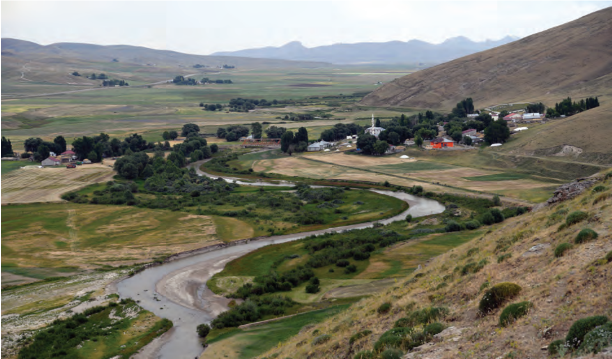
Նպատ լեռան հյուսիսային ստորոտով հոսող Արածանի գետը, որտեղ Լուսավորիչը մկրտեց Տրդատ Մեծին

Ժամկետը, երանելի Գրիգորը առավ աշխարհաբանակ գորքը և իրեն՝ թագավորին, նրա տիկին Աշխենին, մեծ օրհորդ Խոսրովիդուխտին, ամենայն մեծամեծներին և բանակի բոլոր մարդկանց, առավոտյան այգը լուսանալուն պես, Եփրատ գետի ափը տարավ և այնտեղ մկրտեց...» 4 : Սկրտությունից հետո լեռան հյուսիսային լանջին Լուսավորիչը կառուցում է եկեղեցի, որտեղ էլ ամփոփում է Հովհաննես Սկրտչի մատուցները. «Այնտեղ հիմքեր դրեց, եկեղեցի շինեց ու սրբերի ոսկորների նշխարները, որ ունեք, տեղավորեց տերունական տանը» 5 :