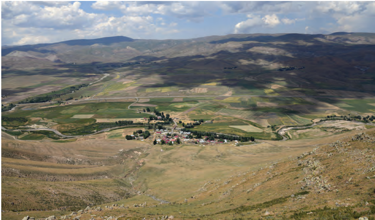
Ձիրավի դաշտը Նպատ լեռան գագաթից (ուս.՝ Ս. Դանիելյանի, 2025 թ.)

րի ծանօթութիւն, Նպատայ գագաթն գտնուած եկեղեցին և Մեծն Ներսիսի աղօթատեղին , վանքի կալուածոց տարածութիւնը և մի անգամ Պարսից և Օսմանցոց պատերազմին վանքիս մէջ անցած դէպքերն, որք շատ հետաքրքրական են և յատուկ առանձին նկարագրութեան են կարօտ» 13 : Հեղինակը լեռան գագաթին նշում է մեկ եկեղեցու և Ներսես Մեծի աղօթատեղիի՝ հավանաբար երկրորդ մատուռ-սրբավայրի մասին: