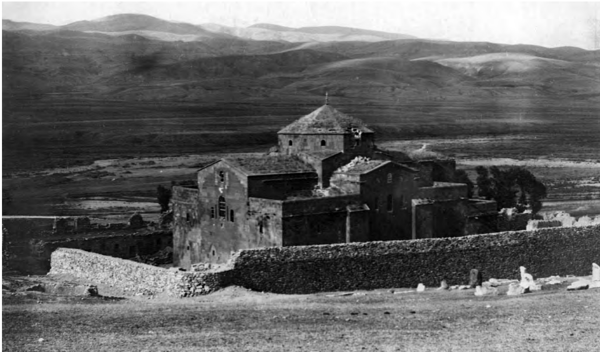
Բագրևանդի Սբ. Հովհաննես վանքը հարավ-արևմուտքից (լուս.՝ անհայտ հեղինակի, 1900-ական թթ.)

շարունակում է. «Դու, արքա՛, արա, ինչ որ ասում ենք քեզ. ա՛ռ Ներսես եպիսկոպոսապետին, զնա՛ Նպատ լեռը, մի ամուր անվտանգ տեղ նստի՛ր, և թող Ներսես եպիսկոպոսապետը աղոթք անի և խնդրի աստծուց, որ մեզ հաղթություն տա: Այնտեղից բարձրից կնայես և կտեսնես մեր ջանքերն ու աշխատանքը պատերազմի ընթացքում, ամեն մեկի քաջությունն ու երկչոտությունը, որ քո առաջ կկատարվեն: Պապ թագավորը համաձայնվեց այս խոսքերին, իր հետ վերցրեց Ներսես քահանայապետին և ելավ նստեց Նպատ լեռան վրա...» 9 : Ճակատամարտի ավարտի մասին էլ նշում է. «Այսպես, լեռան վրա կանգնած, այս և սրանց նման և էլ ավելի բաներ խոսեց (Ներսեսը), մինչ թագավորի հետ կանգնած էր լեռան վրա, բազմաթիվ ու տեսակ-տեսակ աղոթքներ էր անում մինչև երեկո՝ արեգակի մայր մտնելը, մինչև կռիվը վերջացավ» 10 :