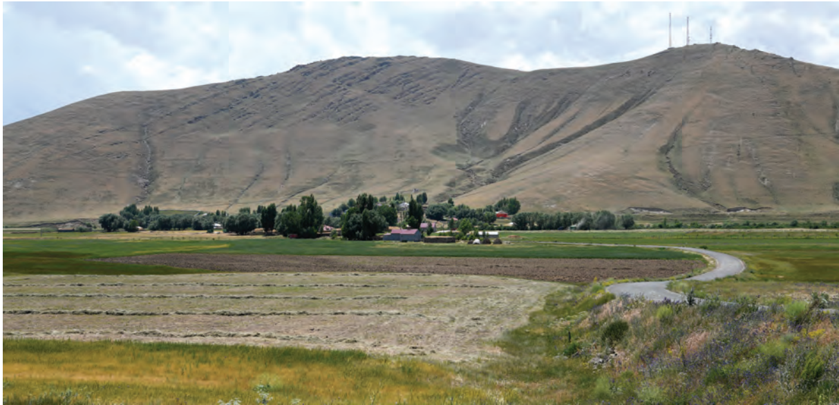
Նպատ լեռը հյուսիսից

Անհիշելի ժամանակներից Նպատը հայերի համար ամենաարքազան լեռներից է: Նրա ստորոտին՝ Արածանիի ափին են կատարվել նավասարդյան տոնակատարությունները, որի մասին Հայկ Ասատրյանը նշում է. «Հին հայերի Նաասարդ նշանատր ատոր հանդիսավայրն Այրարատ նահանգի Բագրևանդ (Ալաշկերտ) գաւառի Բագաւան կամ Դիցաւան մեհենական ասանն էր: Բագաւանը գտնուում էր Չիրաւ լեռնադաշտում՝ Արածանի գետի անմիջական եզրին և Նպատ կոնաձև լեռան ստորոտում» 1 :