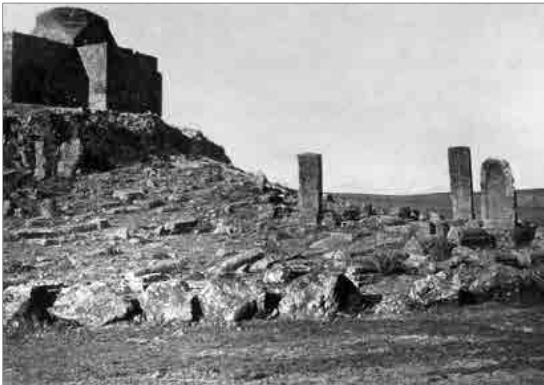
Խնուսցի հայ կանայք Ի դարի սկզբին և Մծնկերտի Սբ. Կարապետ վանքը 1913 թ. Armenian women from Khnus (early 20th century), and Sourb Karapet Monastery of Mezhenkert (1913)