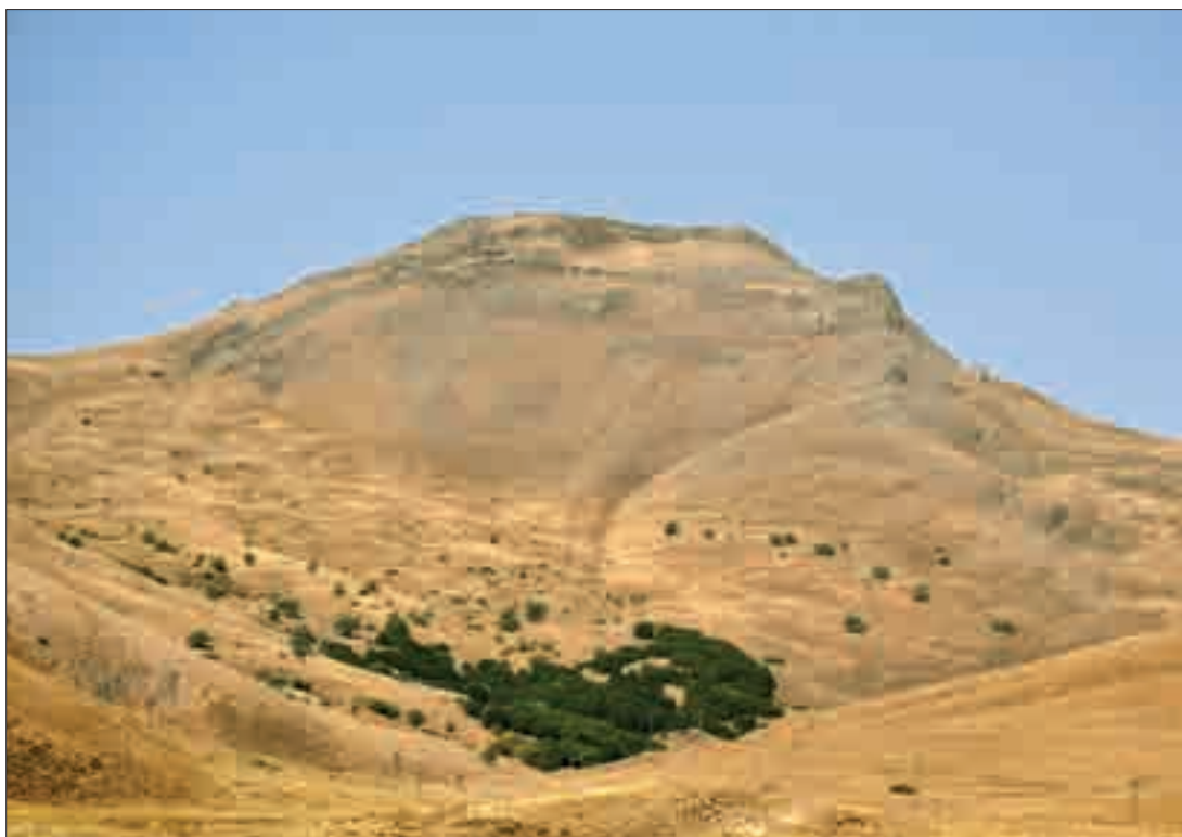
Կարմրակ սրբատեղին Սարլի գյուղի տարածքում և Գազանչիի ուշբրոնզեդարյան բերդը A sacred site called Karmrak in Sarli Village, and the Late Bronze Age fortress of Ghazanchi