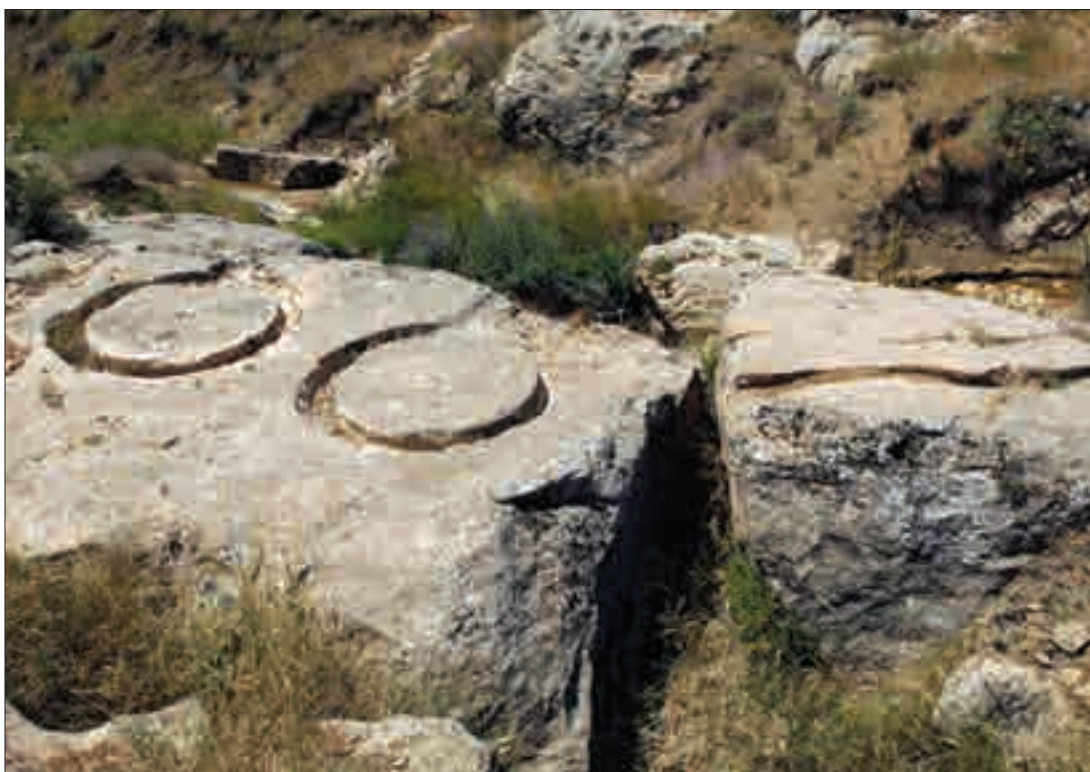
Դ-Ե դարերի ճարտարապետական բեկոր Արոս գյուղում և ճշանագրեր Խրդը գյուղի տարածքում An architectural fragment of the 4th to 5th centuries in Aros Village, and rock-cut symbols in Khert Village