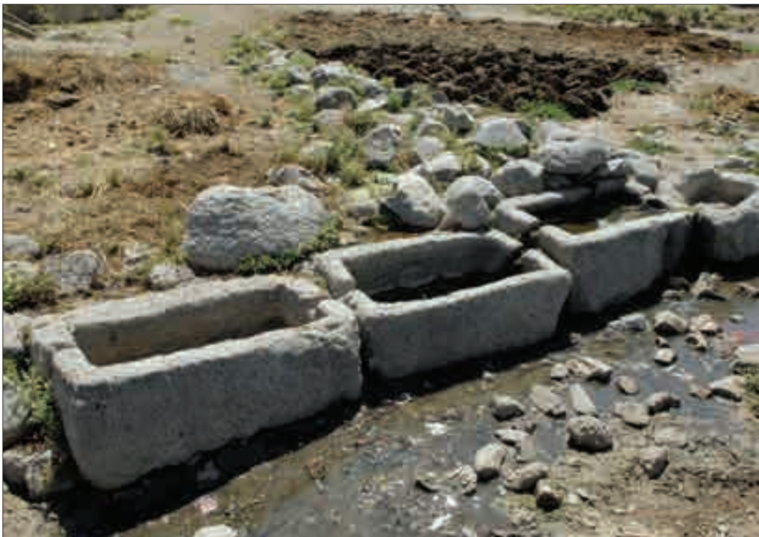
Տեսարան Խնուս քաղաքից և աղբյուրի գոտեր Խաչախույս (Խալիչավուշ) գյուղում View of Khnus City, and fountain troughs in Khachaluyts (Khalilchavush) Village

Խնուս գավառի սահմաններն որվագծում են շուրջօրյոր ճգվող ջրբաժան լեռնաշղթաները, իսկ քնդիանոր մակերևույթը հիմնականում ներառում է Արածանիի ասլավորմյան Խնուս վտակի և նրան օժանդակ Սբ. Դանիելի և Դեղրափի ջրհավար ավազանը: Արևելք-արևմուտք ուղղությամբ ունի մոտ 75 կմ երկարություն, իսկ հյուսիսից հարավ մինչև 44 կմ (այնուրյուն: Գավառի կենտրոնական մասը մի դաշտավայր է, որի միջով հոսող Խնուս գետը երկու կողմերից բնորոնում է բազմաթիվ վտակներ, իսկ արևելյան անկյունն էլ այն միակ դաշտային տեղանքը, որի միջով դուրս գալով Խնուս գետը միախառնվում է Արածանիին: