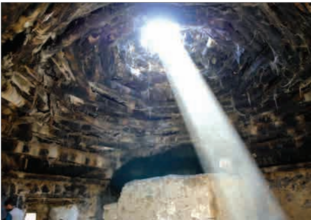
Ջնոնակի բերդը և Գասպարի տան հազարաշեն տանիքը Գասպարգեղում The fortress of Zernak, and the hazarashen ceiling in Gaspar's house in Gaspargegh Village