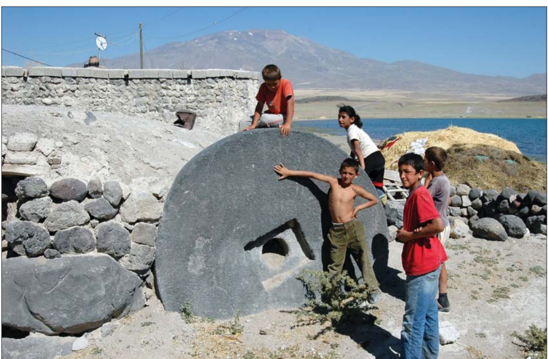
Արծկե (Աղիջեազ) քաղաքն ու բերդը, ձիփանաքար Խոռանց գյուղում The city of Artzke (Adilcevaz) and its castle; an oil press stone in Khorants Village