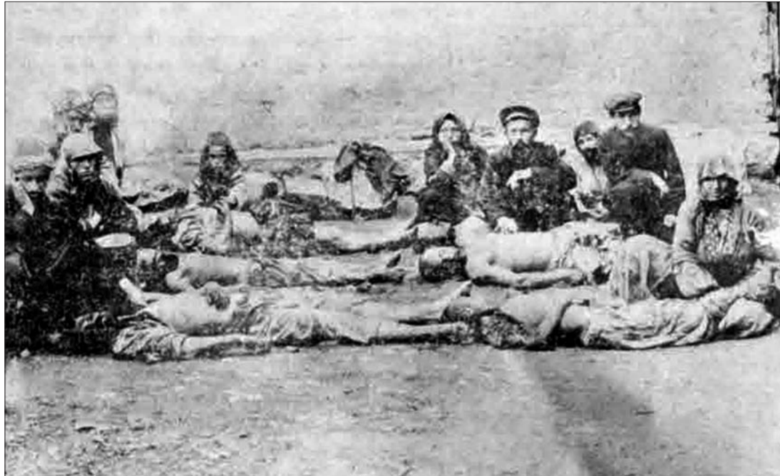
Արծկեցի հայ ընտանիք, 1908 թ. քրդերի ձեռքով սպանված 6 արծկեցիներ An Armenian family from Artzke; the bodies of 6 Armenians from Artzke killed by Kurds