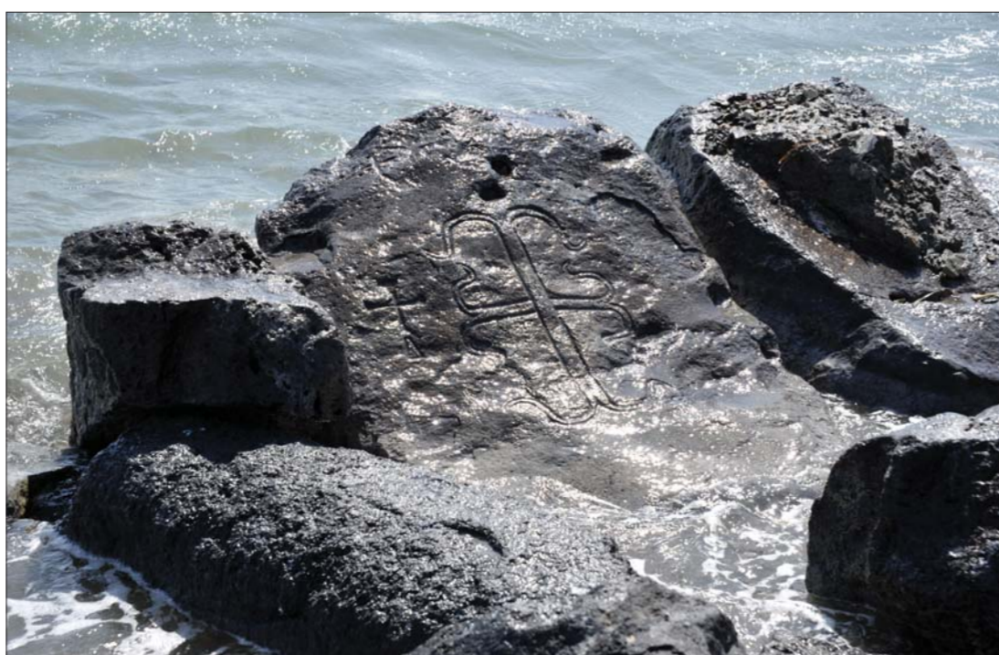
Սրանչեկագործ վանքը, Արջրա գյուղի ծովակույ գերեզմանոցի խաչքարերից մեկը The monastery of Skanchelagortz; one of the cross-stones of the sunken cemetery of Arjra Village