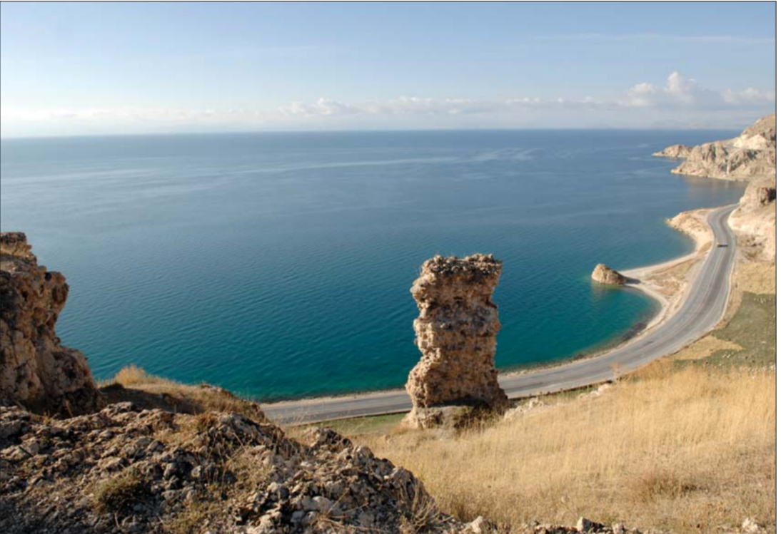
Սիփան (Նեխ Մասիք) լեռ (4058 մ) և Վանա լիճը, տեսարան Արծկեի բերդից Mount Sipan (Nekh Masik, 4,058 m) and Lake Van; the lake as seen from the castle of Artzke

Արծկեն գտնվում է Մեծ Հայքի Տավրոբերան (Տուրոբերան) աշխարհի (նահանգի) Բզնունյաց գավառի արևելյան հատվածում, որը զարգացած միջնադարում գտնվելով Բզնունիքից՝ ձևավորվել է որպես առանձին գավառ: Տարածված է Վանա լճի հյուսիս-աային ափին և սկսվելով Կափեզից՝ հասնում է մինչև Սիփան լեռան գագաթով ձգվող ջրբաժան գիծը: Մ.թ.ա. 16-2 դարերում Վանի թագավորության կարևոր և պաշտպանական ամրություններով հորացված տարածաշրջաններից էր: Է դարում գավառը նվաճում և ավերում են արաբները: 885-1001 թթ. Արծկեն մաս է կազմում Ամիի Բագրատունյաց, իսկ դրանից հետո՝ Վասպուրականի թագավորության (մինչև 1021 թ.): Այնուհետև նվաճում են բուրք-սելջուկները, որոնց էլ հաջորդում են բուրքնեական ցեղերը: ԺԷ դարում գավառն ապաստակում, իսկ բնակչությանը բռնազարդի են ենթարկում պարսիկները: Չնայած դարից դար ճաշակած արհավիրքներին՝ 1915 թ. ցեղասպանության նախօրեին Արծկե գավառը դեռևս գլխավորապես բնակեցված էր հայերով, որոնց մեծագույն մասը բնաջնջվում է ապրիլի 6-8-ն ընկած ժամանակահատվածում: Գավառն առանձնապես հայտնի էր բարձրորակ ցորենով, որն արտահանվում էր նաև հարևան գավառներ: Այժմ նշանավոր է իր ընկույզով: Արծկեն հարուստ էր հայկական նյութական մշակույթի բազմադարյան և տարբերույթ հուշարձաններով, սակայն դրանց հիմնական մասն անցած տասնամյակների ընթացքում նույնպես ոչնչացվել է: Մույն քարտեզ-ուղեցույցը հասցեագրում ենք պատմական հուշարձաններով հետաքրքրվող հայ և օտար հանրությանը: