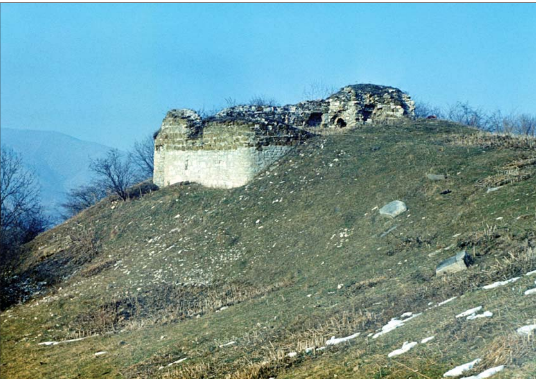
Գյուլիստանի (Հերգա) բերդն ու Երից մանկանց վանքը Շահումյանի շրջանում Gyulistan (Herga) Fortress and Yerits Mankants Monastery in the occupied district of Shahumian

«Մրավականք»-ը ներկայացնում է Արցախի Հանրապետության բռնազավթված և ազատագրված Շահումյանի անվան զույգ շրջանները։ Առաջինը տարածվում է Մռավի լեռնաշղթայի հյուսիսահայաց փեշերին՝ Փորր Կյուրակ և Ինջա գետերի միջնահատվածում և դեռևս վաղ միջնադարում տարրալուծված էր Մեծ Հայքի Մեծ Կուսան (Արցախ նահանգ) և Ուտի-Առանձնակ (Ուտիք նահանգ) գավառների միջնահատվածում։ Զարգացած միջնադարում գավառն ավելի հայտնի էր Հերգ, իսկ ուշ միջնադարում՝ առավելապես Գյուլիստան անվամբ։ Աղբյուրների հսկողության ներքո է անցել և հայաթափ եղել 1992 թ.։ Նույնամուն երկրորդ շրջանը տարածվում է Մռավի լեռնաշղթայի հարավահայաց փեշերին և ներառում է Տրտու գետի վերին հոսանքի ջրավազ ավազանը։ Միջնադարում առավելապես Ծար կամ Վերին Խաչեն անվանը հայտնի արցախյան այս գավառը գոտ հայաբնակ էր մինչև 1720-ական թթ. կեսերը, որից հետո կամաց-կամաց այստեղ են ներթափանցում առավելապես քրդական ծագմամբ մահմեդական խաշնարած ցեղեր։ Խորհրդային կարգերի հաստատումից հետո մտկոլյան կառավարիչներն այս շրջանը, առանց նույնիսկ ԼՂԻՄ-ի մեջ ներառելու, միացնում են Աղբյուրանին։ 1993 թ. շրջանի ազատագրումը հնարավոր դարձրեց 1992 թ. բռնազավթված Շահումյանի շրջանից արտաքսված բնակիչների՝ այստեղ վերաբնակվելը։ Ընդ որում, ի պատիվ և ի հիշատակ բռնազավթված շրջանի՝ ազատագրված Քարվաճառի շրջանը վերանվանվեց Նոր Շահումյան։ Սույն ուղեցույցը հասցեագրում ենք պատմական հուշարձաններով հետաքրքրվող հայ և օտար հանրությանը։