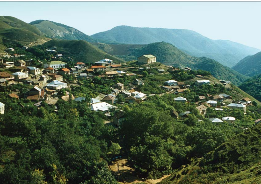
Քոնազավթված Շահումյանի շրջանի Վերիշեն և Գյուլիստան գյուղերը Verishen and Gyulistan Villages in the occupied district of Shahumian